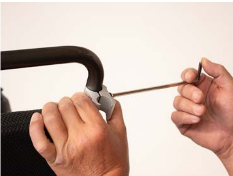
Abbildung 3: Festziehen der Klemmverbindung

Nehme nun die Klemmverbindung und platziere diese, wie in Abbildung 3 dargestellt, am Rahmen des Rollstuhls. Mit Hilfe eines Inbusschlüssels ziehst Du dann die Klemmverbindung leicht an. Wiederhole diesen Schritt für die übrige Rahmenseite. Schiebe nun den U-Bügel von unten in die Klemmverbindung und ziehe den Bügel mittels Inbusschlüssel fest (s. Abbildung 4). Dies wiederholst Du mit dem übrigen Bügel auf der anderen Seite des Rollstuhls.