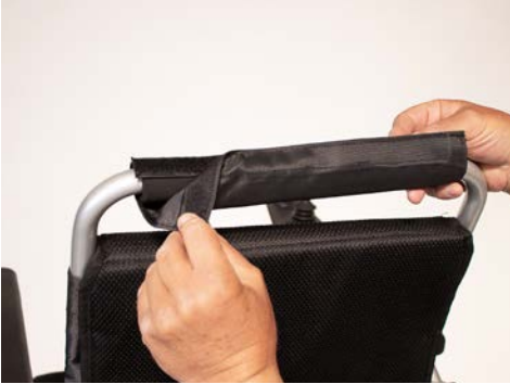
Figure 1: Retirer la housse

Vous pouvez commencer en retirant la housse et la mousse sur la barre de poussée du fauteuil roulant (voir figures 1 et 2).