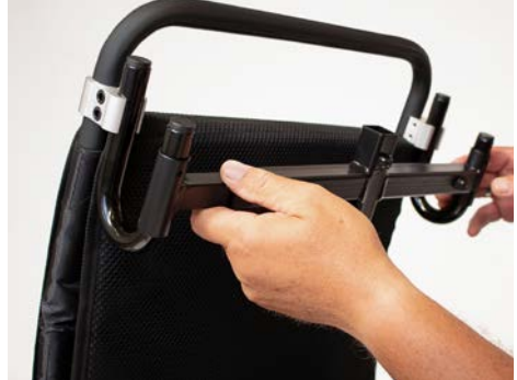
Abbildung 6: Platzieren des Elements über die U-Bügel

Befestige anschließend die Elemente auf beiden Seiten mit Hilfe der Kunststoffclips, indem Du den Stift des Clips durch die Öffnung am U-Bügel schiebst (s. Abbildung 7). Mit Hilfe der beiden Feststellschrauben (s. Abbildung 8) fixierst Du die Anbringung für die Kopfstütze auf beiden Seiten des Rollstuhls.