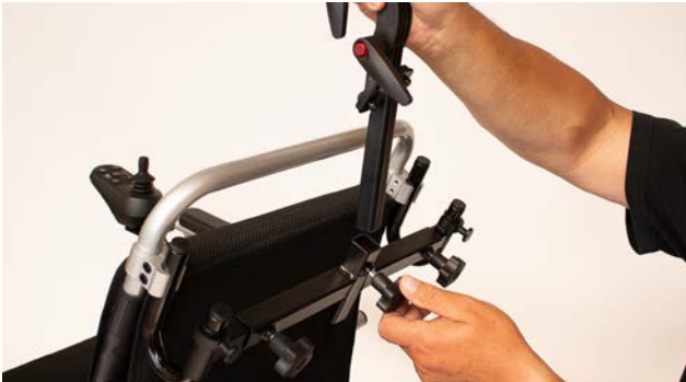
Figure 9: Insérer l'appui-tête

Insérer l'appui-tête dans l'ouverture centrale de la barre transversale et vissez-le avec la vis de blocage restante (voir figure 9).