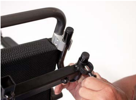
Abbildung 7: Befestigen des Kunststoffclips

Befestige anschließend die Elemente auf beiden Seiten mit Hilfe der Kunststoffclips, indem Du den Stift des Clips durch die Öffnung am U-Bügel schiebst (s. Abbildung 7). Mit Hilfe der beiden Feststellschrauben (s. Abbildung 8) fixierst Du die Anbringung für die Kopfstütze auf beiden Seiten des Rollstuhls.