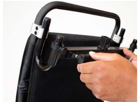
Abbildung 8: Anziehen der Feststellschraube