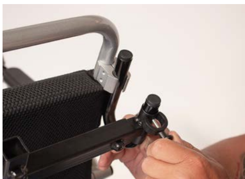
Figure 7: Poser les clip en plastique

Serrez la fixation de l'appuie-tête des deux côtés du fauteuil roulant à l'aide des deux vis de blocage (voir figure 8).