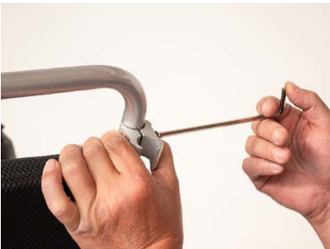
Figure 3: Vérrouiller la connexion de serrage

Répétez cette étape pour le reste du cadre. Insérez maintenant l'étrier en U par le bas dans le raccord de serrage et serrez l'étrier à l'aide d'une clé Allen (voir figure 4). Répétez cette opération avec le reste de l'arceau et l'autre côté du fauteuil roulant.