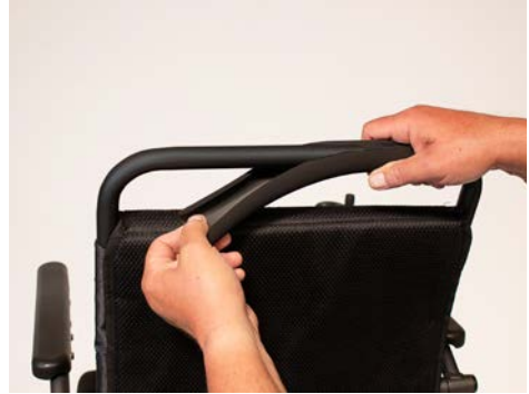
Abbildung 2: Entfernen des Schaumstoffs

Nehme nun die Klemmverbindung und platziere diese, wie in Abbildung 3 dargestellt, am Rahmen des Rollstuhls. Mit Hilfe eines Inbusschlüssels ziehst Du dann die Klemmverbindung leicht an. Wiederhole diesen Schritt für die übrige Rahmenseite. Schiebe nun den U-Bügel von unten in die Klemmverbindung und ziehe den Bügel mittels Inbusschlüssel fest (s. Abbildung 4). Dies wiederholst Du mit dem übrigen Bügel auf der anderen Seite des Rollstuhls.