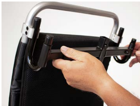
Figure 6: Placer l'élément obtenu à l'aide des étriers en U

Vous pouvez ensuite fixer les éléments des deux côtés : à l'aide des clips en plastique, faites passer la tige du clip par l'ouverture de l'étrier en U (voir figure 7).