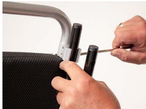
Figure 4: Serrer l'étrier en U