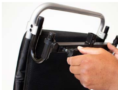
Figure 8: Serrer la fixation de l'appuie-tête