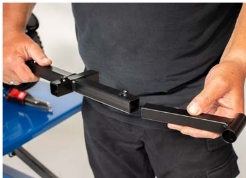
Figure 5: Relier les tiges latérales au support central

Reliez maintenant les deux tiges latérales au support central d'appui-tête comme indiqué sur la figure 5. L'élément ainsi obtenu est maintenant placé sur les étriers en U (voir figure 6).