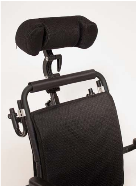
Abbildung 10: Fertig montierte Kopfstütze

Geschafft: Die ergoflix-Kopfstütze ist montiert und kann – je nach Bedarf – individuell eingestellt werden (s. Abbildung 10).