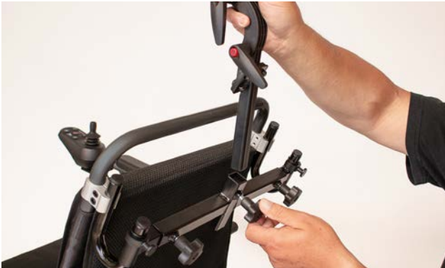
Abbildung 9: Einführen der Kopfstütze

Führe als nächsten Schritt die Kopfstütze in die mittlere Öffnung der Querstrebe und drehe die Kopfstütze mit der übrigen Feststellschraube fest (s. Abbildung 9).