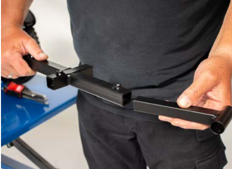
Abbildung 5: Verbinden der Seitenstrebe mit der Querstrebe

Verbinde die beiden Seitenstreben mit der Querstrebe, wie in Abbildung 5 dargestellt. Das entstandene Element wird nun über die U-Bügel gesteckt (s. Abbildung 6).