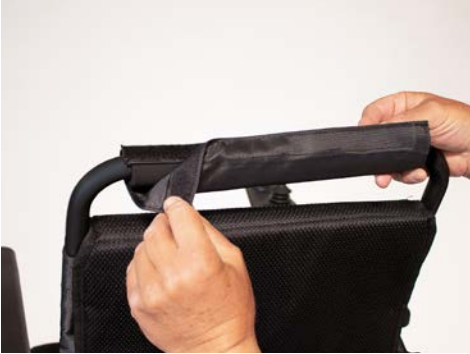
Abbildung 1: Entfernen des Bezugs

Entferne zunächst den Bezug und den Schaumstoff am Schiebebügel des Rollstuhls (s. Abbildung 1 und 2).