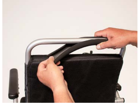
Figure 2: Retirer la mousse

Prenez maintenant le raccord de serrage et placez-le sur le cadre du fauteuil roulant comme indiqué sur la figure 3. Serrez légèrement le raccord de serrage à l'aide d'une clé Allen.