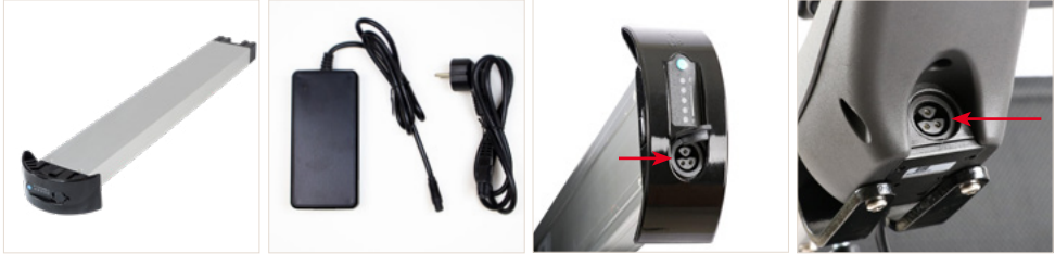
Abbildung 1: Akku des ergoflix®LX und mit dem dazugehörigen Ladegerät und Anschlüssen