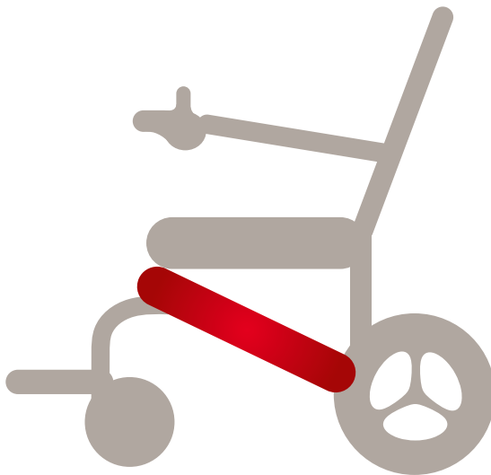
Position Akku ergoflix® LX