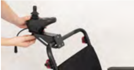
Abbildung 11: Platzieren des Bedienmoduls

Stecke nun das Bedienmodul um und schraube es mithilfe der Feststellschraube an den Adapter (s. Abb. 11). Um das Bedienmodul wieder anzuschließen, löse das Kabel an den Seiten des Rollstuhls (s. Abb. 12).