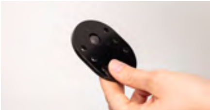
Abbildung 7: Platte mit eingesetzter Schraube

Drehe die Adapterplatte um, damit das Schraubenende nach oben gerichtet ist. Nun kann die Platte auf der Unterseite des Bedienmoduls aufgelegt werden (s. Abb. 8). Achte darauf, diese mit der Schraube nach vorne auszurichten. Durch die verschiedenen Löcher in der Platte kannst Du die Position des Bedienmoduls ganz bequem an Dich anpassen .