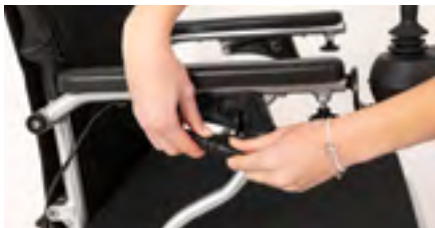
Figure 5: Séparation du câble

Déconnectez le câble du module de commande en tournant la molette et en la en tirant (voir figure 5). Vous pouvez ensuite desserrer la vis de blocage et retirer le module de commande de son support (voir figure 6).