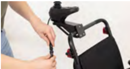
Abbildung 13: Verbinden des Kabels

Verbinde danach die beiden Stecker mit der Pfeilmarkierung zueinander und drehe anschließend am Rädchen (s. Abb. 13). Der Bedienmodul-Adapter für Begleitpersonen ist nun fertig montiert (s. Abb. 14).