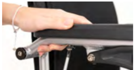
Figure 16: Serrage de la vis