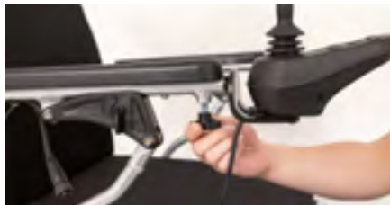
Figure 6: Desserrage la vis de blocage

Dévisser les vis de la fourche à l'aide d'un tournevis cruciforme (voir figure 7) et conservez la fourche démontée (voir figure 8).