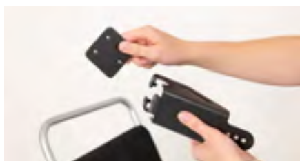
Figure 2: Séparation des éléments

Positionnez le support sur la poignée de poussée (voir figure 3). Ensuite, montez à nouveau la plaque sur le support à l'aide des vis (voir figure 4) en s'assurant d'un serrage optimal. Vérifiez que l'ensemble soit suffisamment serré sur la poignée de poussée.