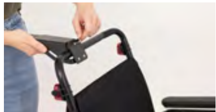
Abbildung 4: Festdrehen der Schrauben

Bei älteren Bedienmodulen (ausgenommen ergoflix® LX in Weiß und Rot und neue Mi2 Variante) ist eine Adapterplatte notwendig, um das Zubehör korrekt verwenden zu können. Du benötigst einen Kreuzschraubendreher PH2, um die Schritte vor der finalen Montage anzuwenden. Ansonsten kannst Du bei der Abbildung 11 fortfahren.