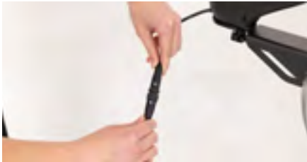
Figure 17: Connexion du câble

Branchez les connecteurs ensemble en alignant les flèches, puis serrez la bague d'un quart de tour (voir figure 17). L'ensemble de commande tierce-personne devrait être convenablement monté à présent (voir figure 18).