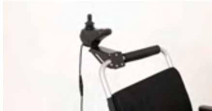
Figure 18: Vue d'ensemble monté