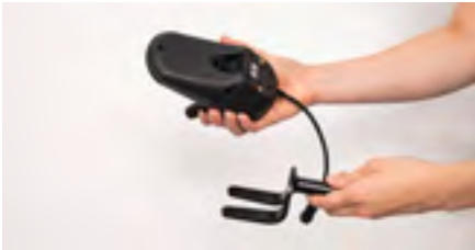
Abbildung 5: Abgetrennte Gabel

Entferne bei älteren Modulen die vorhandene Gabel vom Bedienmodul (s. Abb. 5). Nimm die Adapterplatte zur Hand und setze die einzelne dickere Schraube in das Loch (s. Abb. 6). Diese muss vollständig eingesetzt werden (s. Abb. 7).