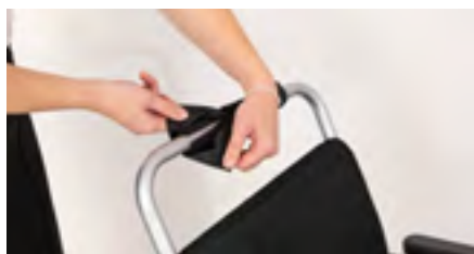
Figure 1: Retrait de la protection rembourrée

Retirez tout d'abord la protection rembourrée présente sur de la poignée de poussée (voir figure 1). Ensuite, dévissez la plaque carrée du support de boîtier de commande (voir figure 2).