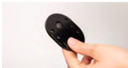
Figure 10: Plaque avec vis en place