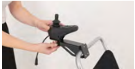
Figure 14 : Montage du boîtier de commande

Desserrez la vis avec le câble sous l'accoudoir (voir figure 15) et retirez le câble de la boucle en caoutchouc. Revissez ensuite la vis unique sous l'accoudoir pour la fixer (voir figure 16). La boucle en caoutchouc peut facilement être fixée à nouveau.