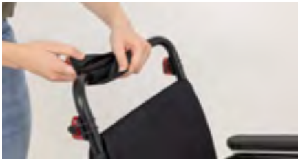
Abbildung 1: Entfernen des Polsters

Entferne zunächst das vorhandene Polster vom Schiebebügel (s. Abb. 1) und bereite den Adapter vor, indem Du die Platte mithilfe des Torx-Schlüssels vom Adapter löst (s. Abb. 2).