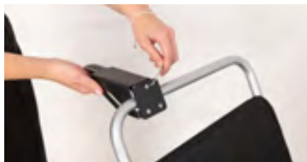
Figure 4: Serrage des vis