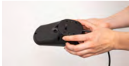
Abbildung 8: Auflegen der Platte

Setze die übrigen Schrauben ein und drehe diese per Hand fest. Ziehe die Schrauben danach noch mit einem Kreuzschraubendreher an (s. Abb. 9). Die Adapterplatte ist fertig montiert (s. Abb. 10). Fahre nun mit der weiteren Anleitung fort.