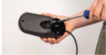
Figure 12: Serrage de la plaque

Le montage de la plaque d'adaptation est terminé (voir figure 13). Montez le boîtier de commande sur son nouveau support à l'aide des vis de serrage (voir figure 14).