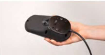
Figure 13: Plaque d'adaptation montée

Le montage de la plaque d'adaptation est terminé (voir figure 13). Montez le boîtier de commande sur son nouveau support à l'aide des vis de serrage (voir figure 14).