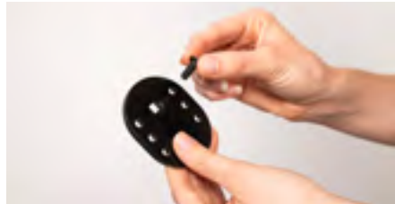
Abbildung 6: Einsetzen der Schraube

Drehe die Adapterplatte um, damit das Schraubenende nach oben gerichtet ist. Nun kann die Platte auf der Unterseite des Bedienmoduls aufgelegt werden (s. Abb. 8). Achte darauf, diese mit der Schraube nach vorne auszurichten. Durch die verschiedenen Löcher in der Platte kannst Du die Position des Bedienmoduls ganz bequem an Dich anpassen .