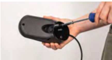
Abbildung 9: Festdrehen der Platte

Setze die übrigen Schrauben ein und drehe diese per Hand fest. Ziehe die Schrauben danach noch mit einem Kreuzschraubendreher an (s. Abb. 9). Die Adapterplatte ist fertig montiert (s. Abb. 10). Fahre nun mit der weiteren Anleitung fort.