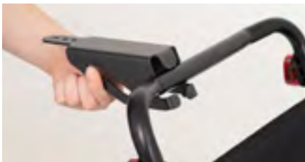
Abbildung 3: Anlegen des Adapters

Lege den Adapter an den Schiebebügel an (s. Abb. 3). Bringe nun die Platte mithilfe der Schrauben wieder an den Adapter an (s. Abb. 4). Achte hierbei darauf, alle Schrauben gut anzuziehen, damit der Adapter nicht verrutscht.