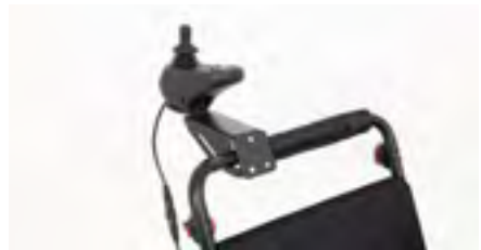
Abbildung 14: Fertig montierter Adapter