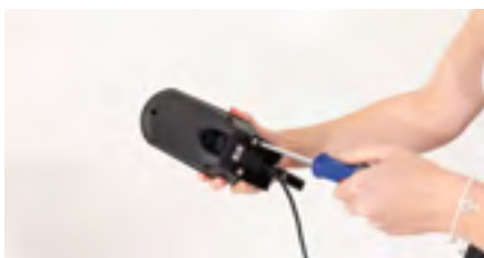
Figure 7: Desserrage des vis

Dévisser les vis de la fourche à l'aide d'un tournevis cruciforme (voir figure 7) et conservez la fourche démontée (voir figure 8).