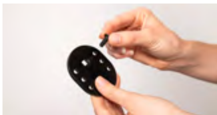
Figure 9: Mise en place de la vis

Prenez maintenant la plaque d'adaptation et insérez la vis unique plus épaisse dans le trou (voir figure 9). Celle-ci doit être complètement insérée (voir figure 10).