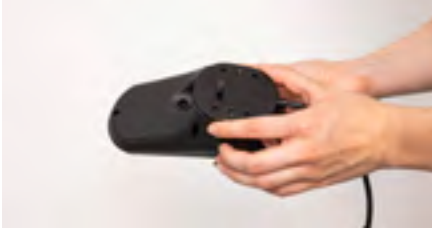
Figure 11: Mise en place de la plaque d'adaptation sous le module de commande

La plaque d'adaptation peut maintenant être posée sur la face inférieure du module de commande (voir figure 11). Veillez à l'orienter avec la vis vers l'avant. Les différents trous de la plaque vous permettent d'adapter facilement la position du module de commande à vos besoins. Insérez les autres vis et vissez-les à la main. Serrez ensuite les vis à l'aide d'un tournevis cruciforme (voir figure 12).