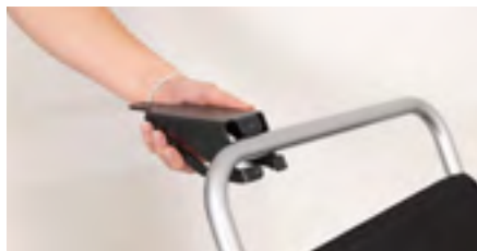
Figure 3: Mise en place du support

Positionnez le support sur la poignée de poussée (voir figure 3). Ensuite, montez à nouveau la plaque sur le support à l'aide des vis (voir figure 4) en s'assurant d'un serrage optimal. Vérifiez que l'ensemble soit suffisamment serré sur la poignée de poussée.