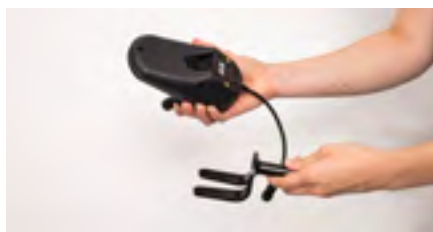
Figure 8: Fourche détachée

Prenez maintenant la plaque d'adaptation et insérez la vis unique plus épaisse dans le trou (voir figure 9). Celle-ci doit être complètement insérée (voir figure 10).