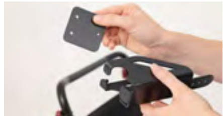
Abbildung 2: Trennen der Einzelteile

Lege den Adapter an den Schiebebügel an (s. Abb. 3). Bringe nun die Platte mithilfe der Schrauben wieder an den Adapter an (s. Abb. 4). Achte hierbei darauf, alle Schrauben gut anzuziehen, damit der Adapter nicht verrutscht.