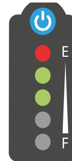
Ladestands- anzeige am ergoflix-Akku

Die ergoflix-Akkus verfügen über eine Entladeschutzschaltung. Das bedeutet, dass das Ladelevel bewahrt wird. Diese Schaltung schützt jedoch nicht vor Selbstentladung bzw. Tiefentladung. Um das Ladelevel der ergoflix-Akkus zu überprüfen, drücken Sie auf die Taste über der Ladestandsanzeige der Akkus. Der Ladezustand wird durch fünf leuchtende LEDs angezeigt. Leuchten bei Ihnen zwischen 2 und 3 Leuchten auf, so befindet sich der Lithium-Ionen-Akku von ergoflix in einem optimalen Zustand für eine Lagerung.