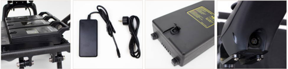
Abbildung 1: Akku des JBH® Carbon 16, dem dazugehörigen Ladegerät und Anschlüssen