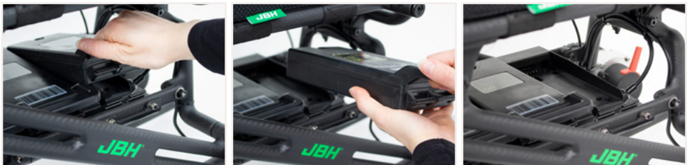
Abbildung 2: Entnehmen der Akkus mithilfe des seitlichen Griffs, um sie außerhalb des elektrischen Rollstuhls zu laden.

Alternativ können die Akkus auch entnommen werden, um sie außerhalb des elektrischen Rollstuhls zu laden. Auch dies geht besonders einfach. Dazu wird der Akku am seitlichen Griff gefasst und mit leichtem Druck schräg nach oben rausgezogen.