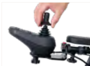
Figure 3 : Retrait de l'embout standard du joystick

Enfin, assurez-vous que le nouvel embout est bien fixé et correctement en place.