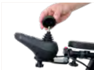
Figure 4 : Placement du nouvel embout sur la goupille métallique