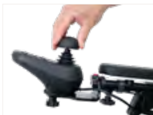
Figure 5 : Placement du nouvel embout sur la goupille métallique

Votre nouvel embout de joystick, conçu pour améliorer le confort lors de la direction et de la conduite, est maintenant prêt à l'emploi.