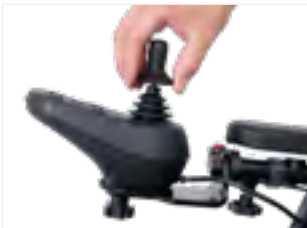
Abbildung 3: Abziehen des Standard-Joystickaufsatzes

Greife den obersten Ring des Joysticks am Bedienmodul Deines Rollstuhls von ergoflix und ziehe diesen nach oben ab (s. Abb. 3). Nimm nun den neuen Joystickaufsatz und platziere diesen mit der Öffnung, die sich unterhalb des Aufsatzes befindet auf dem Pin des Joysticks des Bedienmoduls (s. Abb. 4). Drücke nun den neuen Aufsatz nach unten auf den Pin fest (s. Abb. 5). Prüfe zuletzt, ob der neue Aufsatz fest und richtig sitzt.