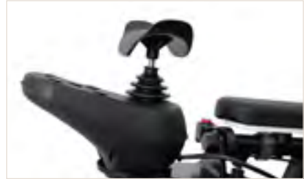
Abbildung 2: Joystickaufsatz Tetragabel