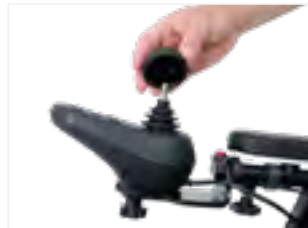
Abbildung 4: Aufsetzen des neuen Aufsatzes auf dem Metallstift