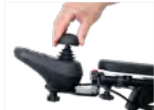
Abbildung 5: Festdrücken des neuen Joystickaufsatzes

Dein neuer Joystickaufsatz für mehr Komfort beim Lenken und Fahren ist nun einsatzbereit.