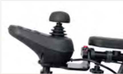
Abbildung 1: Joystickaufsatz Komfortknauf

Hierfür bieten wir Dir neben dem Standard-Joystickaufsatz zwei weitere Aufsätze: