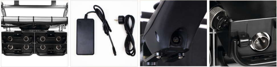
Abbildung 1: Akku des ergoflix® Dura, dem dazugehörigen Ladegerät und Anschlüssen