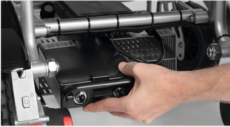
Abbildung 2: Den Akku entnehmen

Entferne zunächst die angeschlossenen Kabel am Akku durch Öffnen des Drehverschlusses. Betätige den Schnappverschluss an der Oberseite und ziehe nun den Akku aus seiner Fassung. Vergewissere Dich vor Gebrauch, dass die Verkabelung der Akkus wieder ordnungsgemäß hergestellt ist.