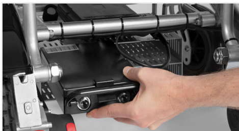
Abbildung 2: Den Akku entnehmen

Entfernen Sie zunächst die angeschlossenen Kabel am Akku durch Öffnen des Drehverschlusses. Betätigen Sie den Schnappverschluss an der Oberseite und ziehen Sie nun den Akku aus seiner Fassung. Vergewissern Sie sich vor Gebrauch, dass die Verkabelung der Akkus wieder ordnungs-gemäß hergestellt ist.