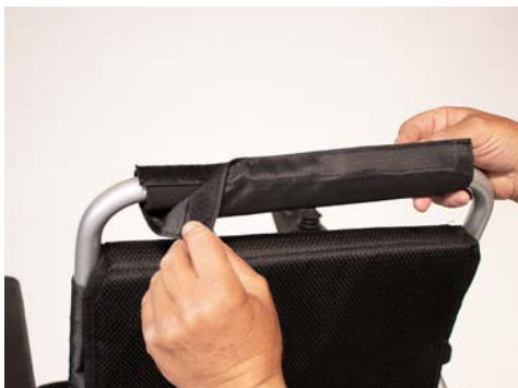
Figure 1: Retirer la housse

Vous pouvez commencer en retirant la housse et la mousse sur la barre de poussée du fauteuil roulant (voir figures 1 et 2).