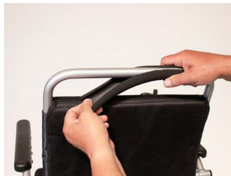
Figure 2: Retirer la mousse

Prenez maintenant le raccord de serrage et placez-le sur le cadre du fauteuil roulant comme indiqué sur la figure 3. Serrez légèrement le raccord de serrage à l'aide d'une clé Allen.