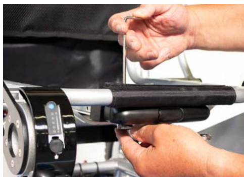
Figure 5 : Fixation des vis

Ensuite, fixez la vis en maintenant l'écrou avec la clé mixte et en serrant la vis avec la clé Allen ou le tournevis cruciforme (voir figure 5 ). Répétez ces étapes pour les trois autres vis et écrous. Testez maintenant si vous pouvez facilement extraire la poignée du trolley (voir figure 6 ).