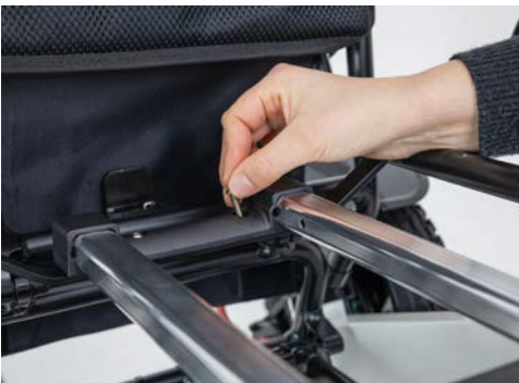
Abbildung 3: Einstecken der Schrauben

Um den Trolleygriff am Rollstuhl anzubringen, führe bitte zunächst die vier beigelegten Schrauben am vorderen und hinteren Teil des Rollstuhls in die dafür vorgesehenen Löcher (s. Abbildung 3). Nimm nun eine der im Paket beigelegten Muttern und drehe diese, wie in Abbildung 4 dargestellt, von unten um die Schraube.