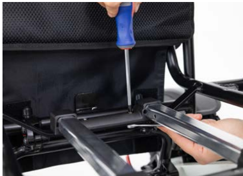
Abbildung 5: Fixieren der Schrauben

Fixiere anschließend die Schraube, indem Du die Mutter mit dem Ring-Maulschlüssel festhältst und die Schraube mit dem Kreuzschlitz-Schraubendreher oder Inbusschlüssel anziehst (s. Abbildung 5). Wiederhole bitte diese Schritte für die übrigen drei Schrauben sowie Muttern. Teste nun, ob Du den Trolleygriff einfach ausziehen kannst (s. Abbildung 6).