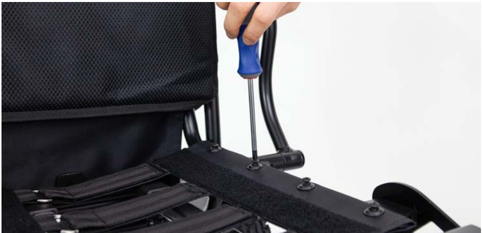
Abbildung 1: Lösen der Schrauben

Entferne zunächst das Sitzpolster des Rollstuhls. Um den Trolleygriff einfacher anbringen zu können, entferne dann die Sitzpolsterunterlage. Du kannst hierzu den Kreuzschlitz-Schraubendreher zur Hand nehmen und damit die acht Schrauben lösen (s. Abbildung 1). Lege die Schrauben anschließend zur Seite.