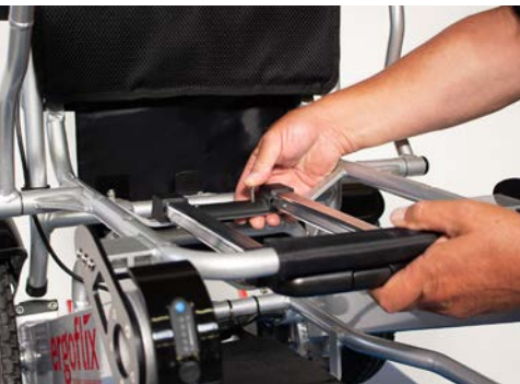
Figure 3 : Insertion des vis

Pour monter la poignée du trolley sur le fauteuil roulant, insérez d'abord les quatre vis jointes à l'avant et à l'arrière du fauteuil roulant dans les trous prévus à cet effet (voir figure 3 ). Prenez ensuite l'un des écrous fournis dans le paquet et tournez-le autour de la vis par le bas comme indiqué sur la figure 4 .