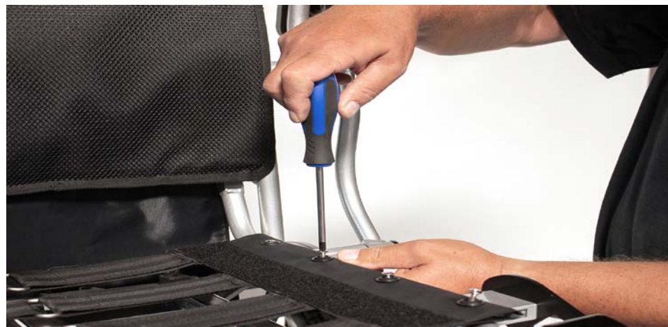
Figure 7 : Fixation du support de coussin de siège

Vissez ensuite le coussin d'assise précédemment retiré sur le fauteuil roulant (voir figure 7 ) et fixez à nouveau le coussin d'assise.