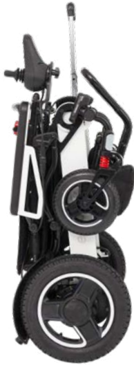
Abbildung 8: Fertig montierter Trolleygriff

Dein ergoflix ist nun einsatzbereit und kann wie ein Reisekoffer gezogen werden.