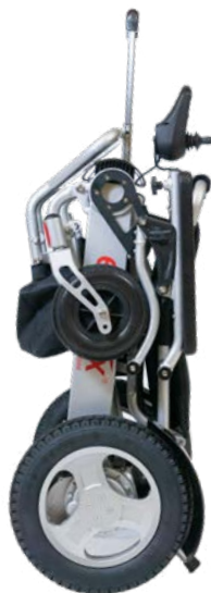
Figure 8 : Poignée de transport trolley montée sur le fauteuil

Votre poignée est maintenant montée ( figure 8 ). Votre fauteuil ergoflix est maintenant à nouveau prêt à l'emploi et peut être tiré comme une valise de voyage.