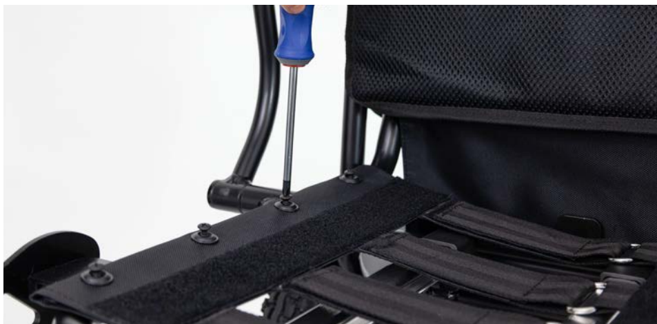
Abbildung 7: Befestigen der Sitzpolsterunterlage

Verschraube danach die zuvor gelöste Sitzpolsterunterlage mit dem Rollstuhl (s. Abbildung 7). Befestige nach Bedarf die Klettthülle wieder vorne am Sitzrahmen und lege dann das Sitzkissen auf die Unterlage.