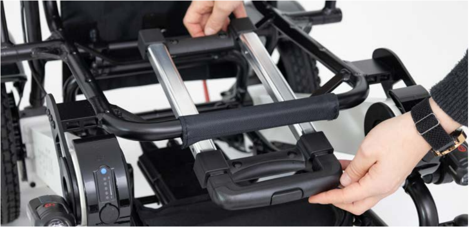
Abbildung 2: Positionieren des Trolleygriffs

Führe den Trolleygriff unterhalb des Sitzrahmens ein (s. Abbildung 2) und entferne die Kletthülle vorne am Sitzrahmen.