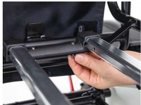
Abbildung 4: Anbringen der Muttern