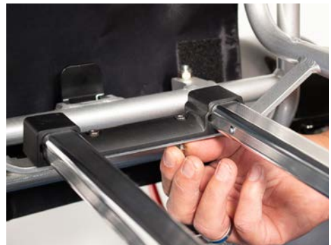
Figure 4 : Mise en place des écrous