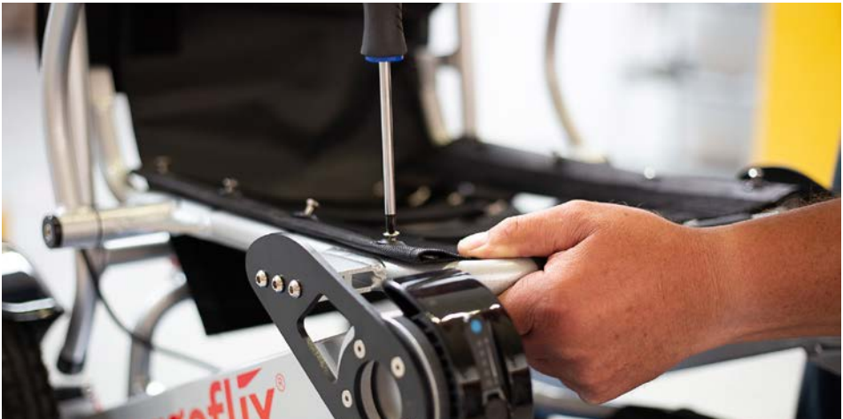
Figure 1 : Démontage du support pour le coussin d'assise

Retirez d'abord le coussin d'assise du fauteuil roulant. Pour pouvoir fixer plus facilement la poignée du trolley, retirez ensuite les cingles de support pour le coussin d'assise. Pour ce faire, prenez le tournevis cruciforme et dévissez les huit vis (voir figure 1 ). Mettez ensuite les vis de côté.