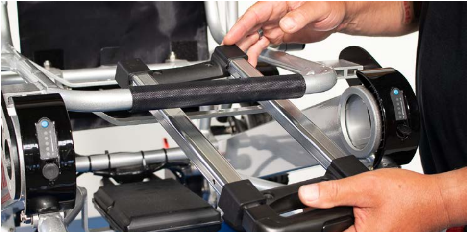
Figure 2 : Positionnement de la poignée de transport trolley

Introduisez maintenant la poignée du trolley sous le cadre du siège (voir figure 2 ).