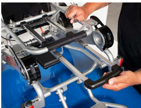
Figure 6 : Extraction de la poignée du trolley

Vissez ensuite le coussin d'assise précédemment retiré sur le fauteuil roulant (voir figure 7 ) et fixez à nouveau le coussin d'assise.