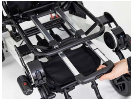
Abbildung 6: Herausziehen des Trolleygriffs

Verschraube danach die zuvor gelöste Sitzpolsterunterlage mit dem Rollstuhl (s. Abbildung 7). Befestige nach Bedarf die Klettthülle wieder vorne am Sitzrahmen und lege dann das Sitzkissen auf die Unterlage.