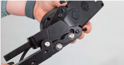
Abbildung 7: Anlegen des Schwenkarms

Schraube nun wieder die Platte mit beiden Schrauben fest und lege den Schwenkarm an die Platte an. Achte darauf, dass der Schraubenkopf passgenau in der größeren Bohrung liegt (s. Abb. 7). Verwende die beigelegte längere Feststellschraube und drehe diese auf die Schraube, um den Schwenkarm zu befestigen (s. Abb. 8).