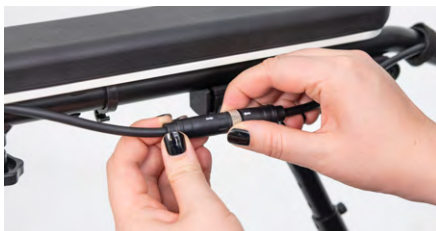
Abbildung 11: Verbinden des Kabels

Um das Bedienmodul wieder anzuschließen, verbinde die beiden Stecker mit der Pfeilmarkierung zueinander und drehe anschließend das silberne Rädchen (s. Abb. 11). Der Schwenkarm wurde erfolgreich montiert (s. Abb. 12).