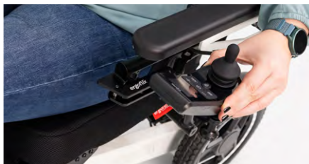
Abbildung 13: Abschwenken des Bedienmoduls

Das Bedienmodul kann nun abgeschwenkt werden. Greife dazu das Bedienmodul und bewege es nach außen hinten (s. Abb. 13). Wenn der Schwenkarm seine Endposition erreicht hat (s. Abb. 14), kannst Du bequem an Objekte heranfahren.