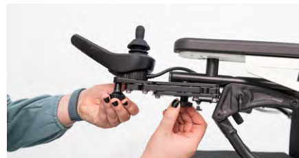
Figure 10 : Serrage de la vis de blocage