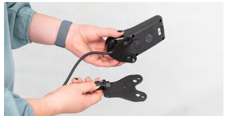
Figure 4 : Séparation de la fourche