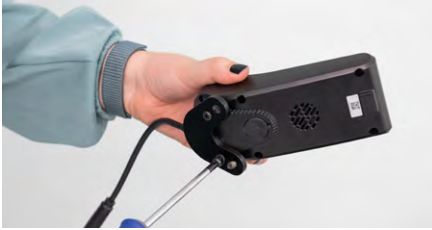
Abbildung 5: Lösen der Schrauben

Löse die Platte unterhalb des Bedienmoduls (s. Abb. 5) und entferne die Unterlegscheiben der beiden Schrauben (s. Abb. 6).