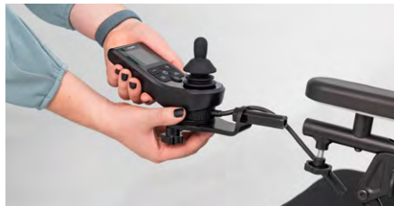
Abbildung 2: Entfernen des Bedienmoduls

Löse an der Unterseite des Bedienmoduls die Sternmutter (s. Abb. 3), um das Bedienmodul von der Gabel zu trennen (s. Abb. 4) und bewahre diese auf, falls Du den Schwenkarm wieder demontierst.