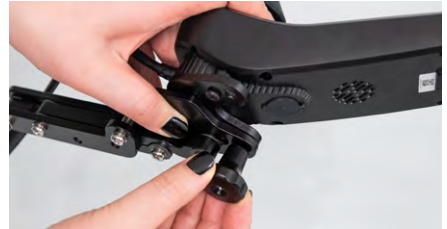
Abbildung 8: Festdrehen der Feststellschraube

Führe nun den Schwenkarm wieder in die Armlehnenöffnung ein (s. Abb. 9). Drehe die Feststellschraube an der Armlehne fest, um den Schwenkarm zu fixieren (s. Abb. 10).