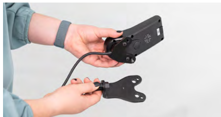
Abbildung 4: Abtrennen der Gabel