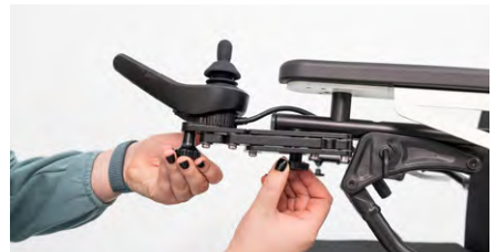
Abbildung 10: Festdrehen der Feststellschraube