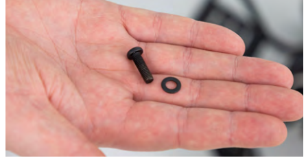
Abbildung 6: Entfernen der Unterlegscheiben

Schraube nun wieder die Platte mit beiden Schrauben fest und lege den Schwenkarm an die Platte an. Achte darauf, dass der Schraubenkopf passgenau in der größeren Bohrung liegt (s. Abb. 7). Verwende die beigelegte längere Feststellschraube und drehe diese auf die Schraube, um den Schwenkarm zu befestigen (s. Abb. 8).