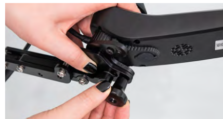
Figure 8 : Serrage de l'écrou de blocage

Insérez à présent le pantographe dans l'ouverture de l'accoudoir (voir fig. 9). Serrez ensuite la vis de blocage située sur l'accoudoir afin de fixer le pantographe (voir fig. 10).