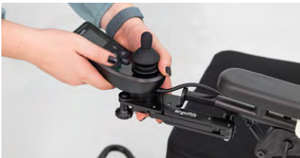
Abbildung 9: Einführen des Schwenkarms

Führe nun den Schwenkarm wieder in die Armlehnenöffnung ein (s. Abb. 9). Drehe die Feststellschraube an der Armlehne fest, um den Schwenkarm zu fixieren (s. Abb. 10).