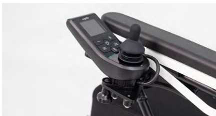
Abbildung 14: Endposition des Schwenkarms

Kontrolliere vor jedem Fahrtantritt, ob die Schrauben am Schwenkarm noch fest angezogen sind. Sollte dies nicht so sein, müssen diese einmal nachgezogen werden.