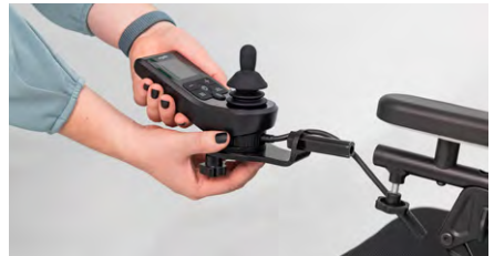
Figure 2 : Retrait du module de commande

Desserrez l'écrou étoilé situé sous le module de commande (voir fig. 3) afin de séparer le module de commande de la fourche (voir fig. 4). Conservez cet écrou au cas où vous démonteriez à nouveau le pantographe.