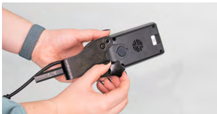
Abbildung 3: Lösen der Sternmutter

Löse an der Unterseite des Bedienmoduls die Sternmutter (s. Abb. 3), um das Bedienmodul von der Gabel zu trennen (s. Abb. 4) und bewahre diese auf, falls Du den Schwenkarm wieder demontierst.