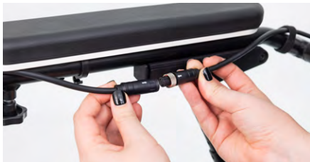
Abbildung 1: Trennen des Kabels

Entferne zunächst das vorhandene Bedienmodul, indem Du das silberne Rädchen am Kabel lockerst und die Stecker auseinanderziehst (s. Abb. 1). Löse die Feststellschraube, um das Bedienmodul aus der Armlehne zu entfernen (s. Abb. 2).