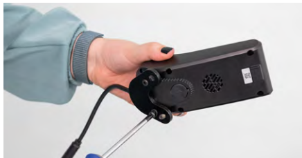
Figure 5 : Desserrage des vis

Desserrez la plaque située sous le module de commande (voir fig. 5) et retirez les rondelles des deux vis (voir fig. 6).