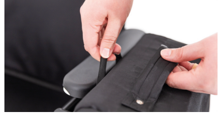
Figure 7 : retrait du sac pour fauteuil roulant

Bon à savoir : le grand sac pour fauteuil roulant est également livré avec une longue sangle de transport. Vous pouvez l'attacher au sac à l'aide des crochets et ajuster la longueur à votre convenance.