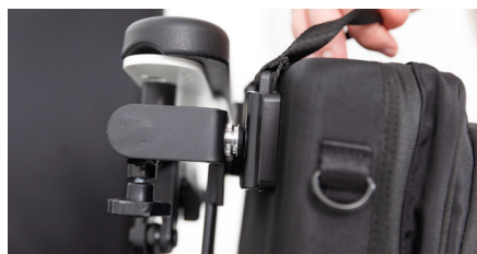
Figure 5 : retrait du petit sac pour fauteuil roulant

Bon à savoir : Une longue sangle de transport est également incluse avec le petit sac pour fauteuil roulant. Vous pouvez l'attacher au sac à l'aide des crochets et ajuster la longueur à votre convenance.