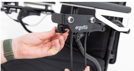
Figure 3 : rotation de la molette de la vis de blocage

Tournez la molette pour serrer à nouveau la vis de blocage et fixer le porte-sac (voir Fig. 3).