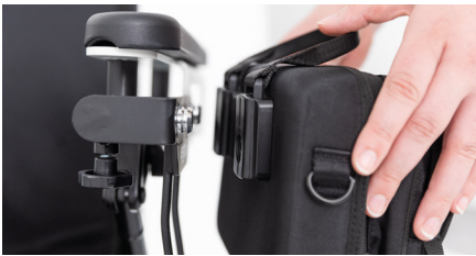
Abbildung 4: Rollstuhltasche ausrichten

Um die kleine Rollstuhltasche wieder zu entfernen, ziehe an der Stoffflasche, so dass sich die Magnete voneinander lösen (s. Abb. 5). Beachte, dass die Stoffflasche nur zum Anbringen und Lösen der Tasche gedacht ist und nicht als Tragegriff im Allgemeinen.