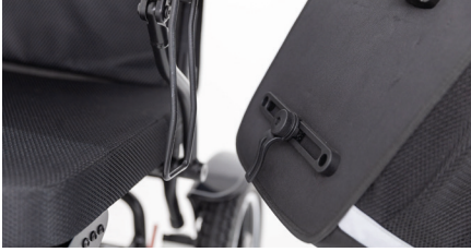
Figure 6 : Accrochage du grand sac pour fauteuil roulant