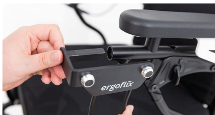
Abbildung 2: Taschenhalter mit dem Rundrohr verbinden

Drehe am Rädchen, um die Feststellschraube wieder festzuziehen und den Taschenhalter zu fixieren (s. Abb. 3).