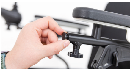
Abbildung 1: Abdeckung entfernen

Löse die Feststellschraube unter der Armlehne und entferne die schwarze runde Abdeckung (s. Abb. 1). Schiebe das Vierkantstück des Taschenhalters in das Rund- rohr Deines Elektrorollstuhls (s. Abb. 2). Achte darauf, dass der Bügel des Taschen- halters nach unten zeigt.