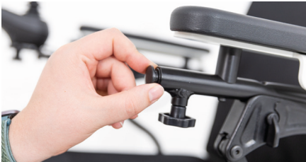
Figure 1 : retrait du capot

Desserrez la vis de blocage sous l'accoudoir et retirez le couvercle rond noir (voir Fig. 1). Faites glisser la pièce carrée du porte-sac dans le tube rond de votre fauteuil roulant électrique (voir Fig. 2). Assurez-vous que le support du porte-sac est orienté vers le bas.