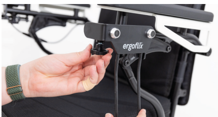
Abbildung 3: Rädchen der Feststellschraube festdrehen

Drehe am Rädchen, um die Feststellschraube wieder festzuziehen und den Taschenhalter zu fixieren (s. Abb. 3).