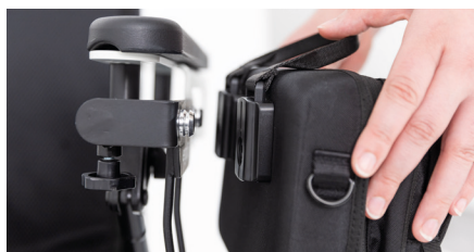
Figure 4 : alignement du sac pour fauteuil roulant au support

Pour retirer le petit sac pour fauteuil roulant, tirez sur la languette en tissu, de manière à séparer les aimants (voir Fig. 5). Notez que le languette en tissu est uniquement destinée à attacher et détacher le sac. Elle ne doit pas être utilisée comme poignée de transport.