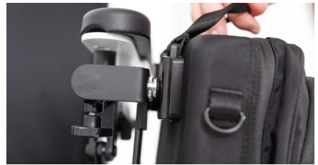
Abbildung 5: Rollstuhltasche entfernen

Gut zu wissen: Mit der kleinen Rollstuhltasche wird auch ein langer Tragegurt mitgeliefert. Diesen kannst Du mit Hilfe der Haken an der Tasche befestigen und die Länge entsprechend einstellen.