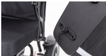
Abbildung 6: Rollstuhltasche einhaken