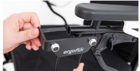
Figure 2 : connexion du porte-sac au tube rond

Tournez la molette pour serrer à nouveau la vis de blocage et fixer le porte-sac (voir Fig. 3).